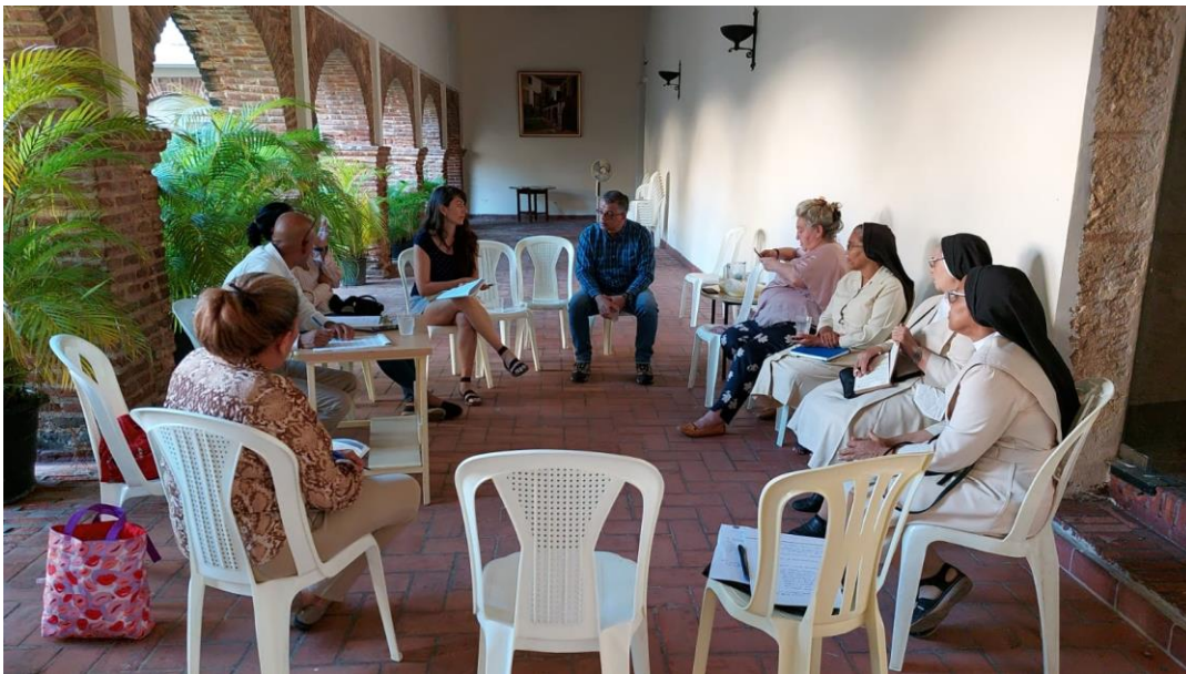
Foto de la reunión del ECOP Las Damas